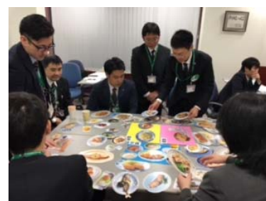
健康サポート薬局機能向上研修 （健康教室体験 献立指導）