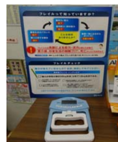
チェックツールと握力測定器